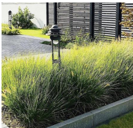
LAMPEPUDDER | PENNISETUM

Blomstring: aug./okt. | gulbrune aks Højde: 30-50 cm Placering: sol/halvskygge