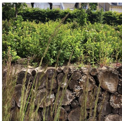
PIBEGRÆS | MOLINIA CAERULEA

Blomstring: aug./okt. | gulbrune aks Højde: 30-50 cm Placering: sol/halvskygge