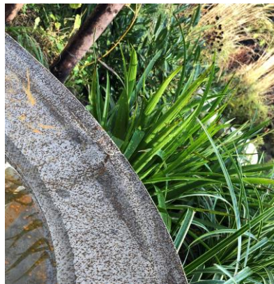
JAPANSK STAR | CAREX MORROWII 'ICE DANCE'

Blomstring juni | grønne Højde: 20-35 cm Placering: sol